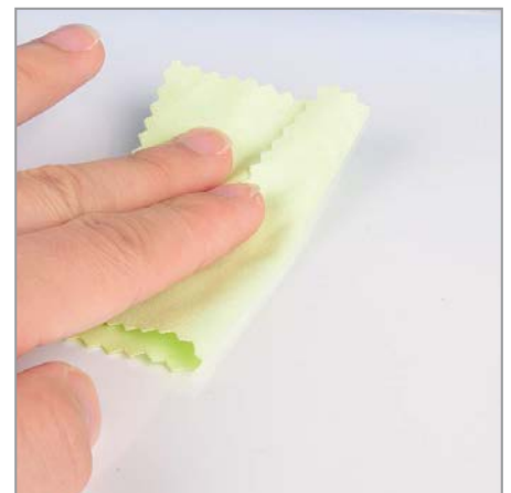
Può essere pulita con acqua o disinfettante