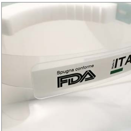
Chiusura con Velcro